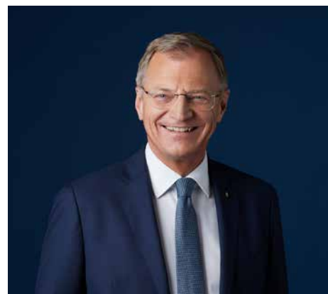
Mag. Thomas Stelzer Landeshauptmann

Es gibt dabei kaum einen Ort in Oberösterreich, der in diesem OÖ Kultursommer „unbespielt“ bleibt. Und das dank der vielen Menschen, die sich für Kunst und Kultur engagieren, mit Leidenschaft und Herzblut dabei sind und uns allen unvergessliche Momente bescheren. Nutzen Sie die Chance, viele solcher kulturellen Momente den Sommer lang zu sammeln.